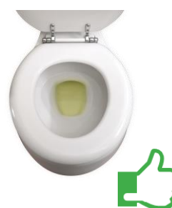
Geel en helder