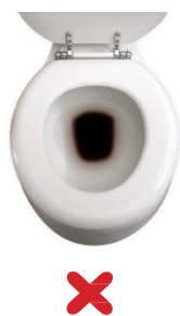
Donker en troebel

De voorbereiding is afgerond wanneer er na het drinken van de liter PLEINVUE en de heldere vloeistoffen alleen nog heldere, soms lichtgele vloeistof in het toilet komt zoals op de laatste afbeelding. U bent dan klaar voor het onderzoek. Door de voorbereiding kunt u last krijgen van hoofdpijn en misselijkheid. Ook kunt zich koud voelen.